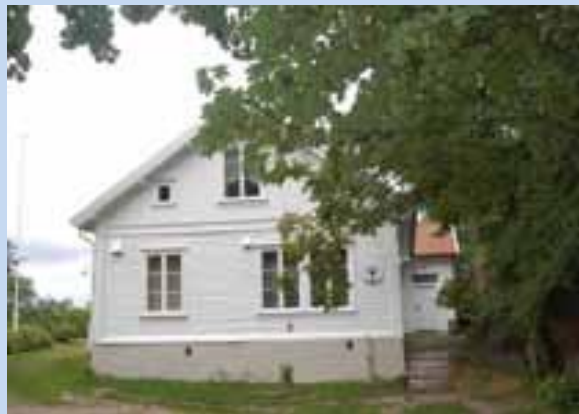
Slik så den ut før brannen.