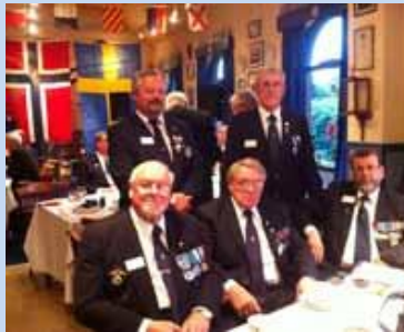
Her kunne en ha det koselig!